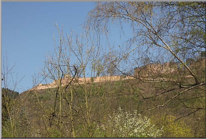
Ausblick auf die Wolfsburg