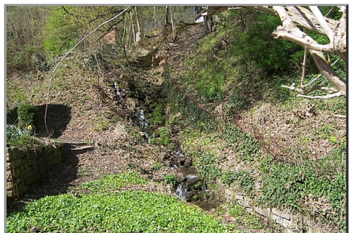
Umgebung mit Bachlauf