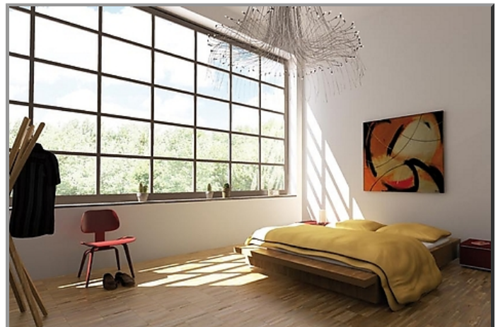
Wohnbeispiel Serie Paris