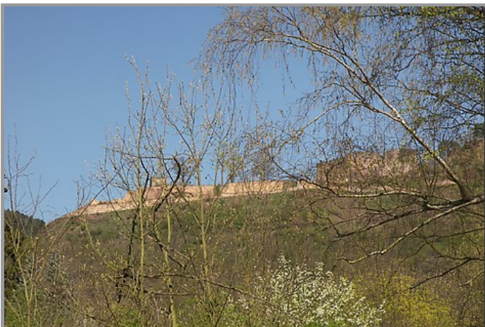
Ausblick auf die Wolfsburg